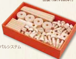
出展:パルシステム